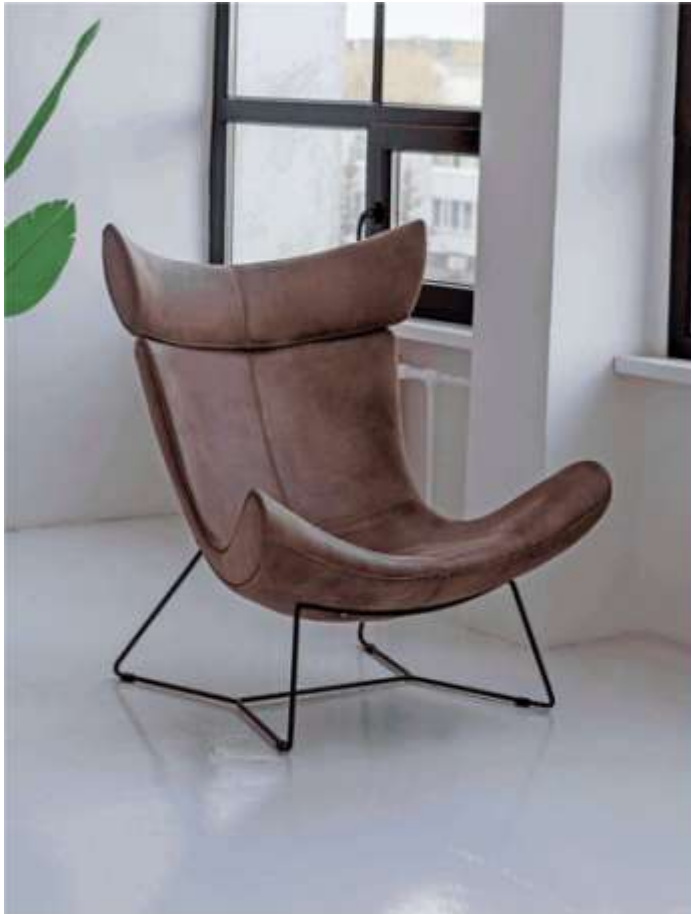
Кресло Оскар 1 (со стационарным основанием)